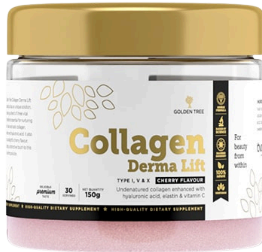
Collagen Derma Lift